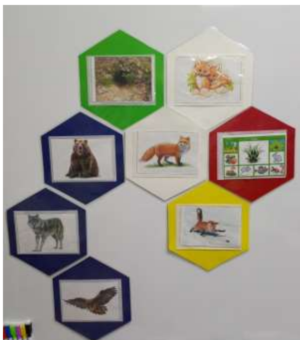
Узучаем диких животных