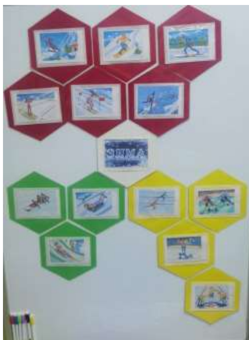
Знакомство с Зимними Олимпийскими играми

По результатам сравнительной диагностики, уровень развития когнитивных способностей у 21 ребенка старшего дошкольного возраста с применением «Гекс-технологии» увеличился в среднем на 30%. Кроме этого использование