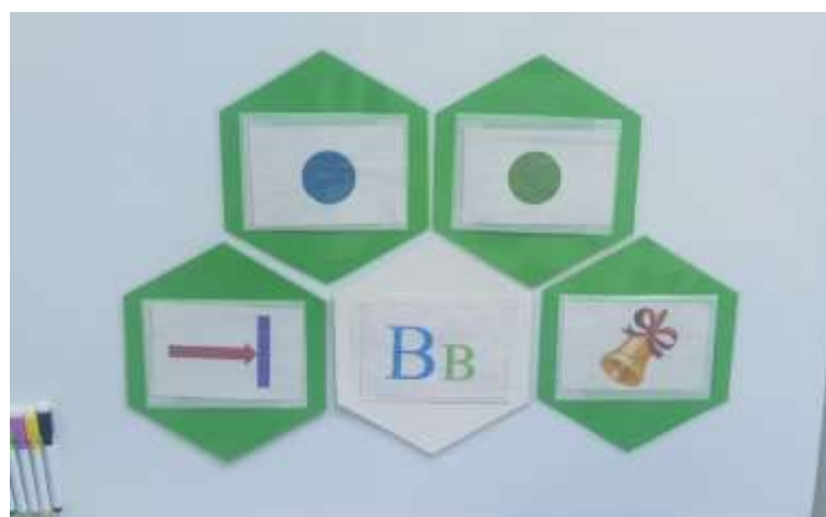
Знакомство со звуками